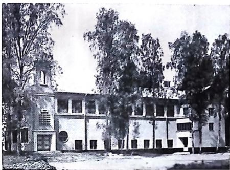
Folkliga musikskolan Ingesund

tillfällen hållas alltid korta föredrag om de kompositioner och mästare, som stå på programmet. Musikstunderna bevistas även av folkhögskolans elever och intresserade från bygden och staden, och för båda skolorna utgöra de veckans rikaste och festligaste stunder.