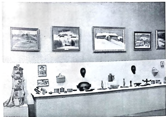
Från utställningen »Beredskapsmannens fritid» i Karlstad 1942

Dess bättre har också svenskt beredskapsfolk under dessa år alltmer lärt sig förstå, att fritidsproblemet inte enbart kan lösas genom centralt genomförda åtgärder. Det kommer under alla förhållanden att finnas rik plats för det personliga initiativet och den egna uppslagsrikedomen. Det är också glädjande att finna, hur förbanden alltmer lärt sig att själva sörja för en god fritidssysselsättning. I stället för att sitta och vänta på sporadiskt ankommande fältartistgrupper och filmbilar, har man tagit saken i egen hand och inventerat vilka tillgångar i förströelseväg, som funnits i den egna kretsen. Dessa egenhändigt ordnade förströelsetillfällen har oftast blivit mera lyckade än de rekvirerade, därför att de väckt större intresse än dessa och tagit den personliga aktiviteten i anspråk. Ofta ha kamraterna i vapenrocken avslöjat förbluffande artistiska färdigheter. Denna form av förströelse har också den fördelen, att den inte är begränsad till en och annan knappt tillmätt timme. Förberedelserna, övningarna och repetitionerna i egna körer, musikkapell och kabarésällskap är oftast det allra roligaste och det bästa uttrycket för gott kamratskap och enig sammanhållning till allas glädje och gagn.