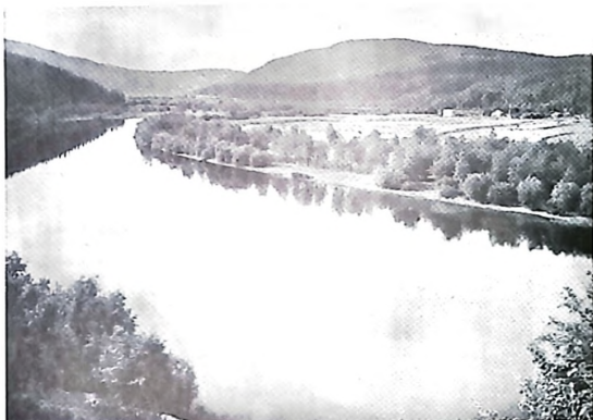
Klarälven i trakten av Fastnäs, Ekshärad

uppe, högt ovan havet och långt från havet. Marken är snötäckt i medeltal 170 dagar pr år, vilket är lika länge som i Sveriges nordligaste stad, Haparanda. Genom den djupa sprickdalen sträckte sig fordom en ishavsfjord ända upp till det nuvarande Värmlands nordligaste socken, Norra Finnskoga. Det var alltså havet, som för omkring 9000 år sedan bestämde hur långt mot norr stenfria jordarter skulle avsättas och därmed också hur långt upp den värmländska triangeln skulle sträcka sin spets. Först år 1895 blev landsväg hit upp färdigbyggd. Den nordligaste gårdens ägare hade då skjutit 39 björnar — ett gott exempel på hur isolerad denna del av Värmland varit ända fram emot våra dagar.