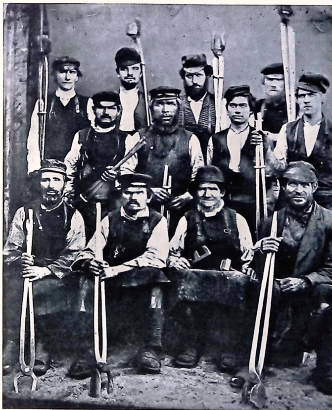
Smeder från Gustafsfors år 1880