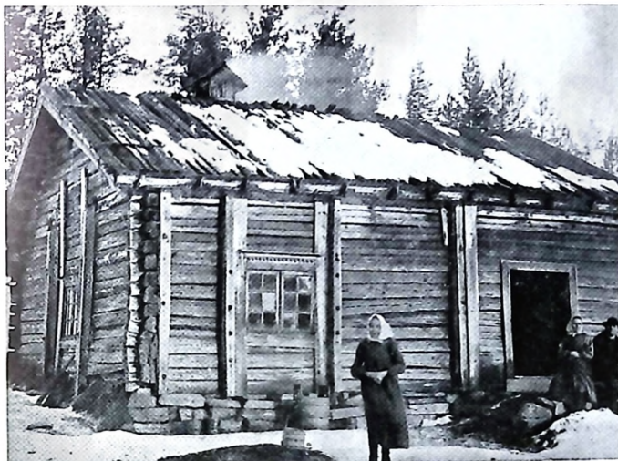
Finntorp från Lekvattnet

socken —, andra räddade till någon av landskapets många hembygdsföreningar, i Fryksände, Vitsand, Lekvattnet, Gräsmark, Västra Värmlands museum på Sågudden vid Arvika samt i Friluftsmuseet Mariebergsskogen, Karlstad.