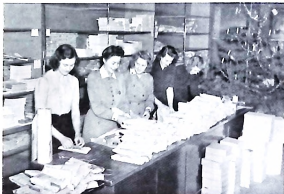
Medhjälpare vid Fältjulklappen 1942