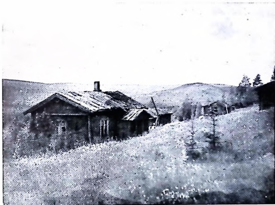
Den värmlands-finska gården Nordmillom i Östmarks s:n

norra Värmland. Alldeles särskilt lockande synes Bergslagen ha varit, där gruvorna och bergshanteringarna hade behov av arbetstillskott.