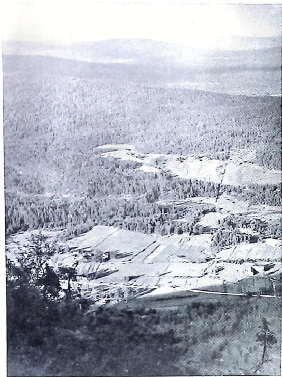
Från Ränneberget i Östmark