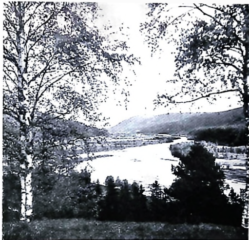
Övre Klarälvsdalen vid Syslebäck

varande dalgångarna. På samma sätt är det på den norska sidan om riksgränsen. Där bo de flesta på botten av den forna ishavsfjord, där Glomma nu flyter. Men mellan dessa bygder ligga glest befolkade skogstrakter. Dem kan man finna med hjälp av sockennamnen, t. ex. på den svenska sidan Östervallskog, Töcksmark, Skillingmark. Och på den norska sidan möta namnen Setskogen, Eidskogen, Vestmarken m. fl.