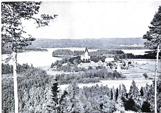
Brunskogs kyrka vid Värmeln i västra Värmland

täppt igen Fryksdalen. Om den ej finnes, skulle "Lövens långa sjö" minskas till en rad småsjöar och Fryksdalen förlora sin storslagna prägel.