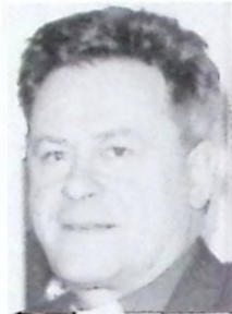
Biskop Bengt Wadensjö