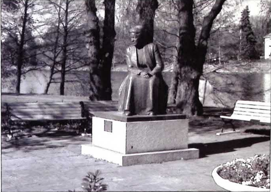
Selma Lagerlöf.