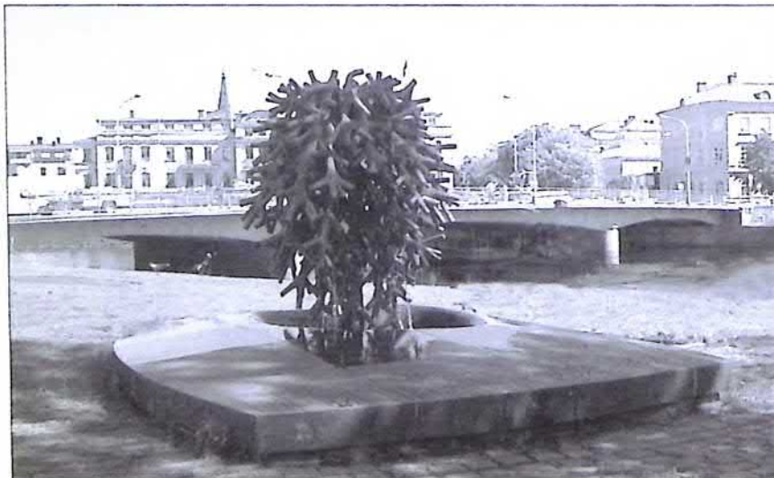
Vindarnas boning

För mer än 400 år sedan kom finska invandrare till Värmland. De röjde skog och odlade upp ödemark. Till minne av denna invandring skänkte