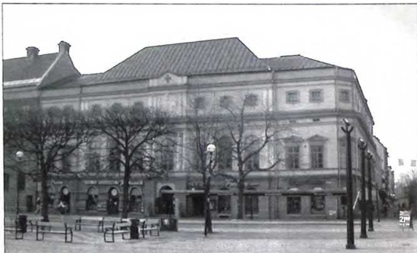
Frimurarlogens hus vid Stora Torget

Det var en gång, det var en Oskarsbal en vinterkväll i stadens festlokal. Jag stod vid dörrn, jag hade lånat fracken, den varför lång, för vid, för hög i nacken mitt skjortveck, styvt och stärkt och brynt i tvätten, stack prydligt av mot vita halsrosetten, en knapp var borta, ena klacken sned, min själ i olag, mitt humör ur led.