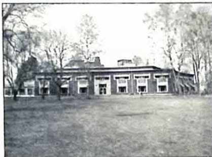
Värmlands Museum, gamla respektive nya delen, foto Andreas Eliazon