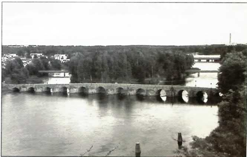
Gamla stenbron

Vid södra brofästet låg stadens östra tull. Därifrån sträckte sig vägen mot stadskärnan rakt upp över Lagberget mellan Gamla gymnasiet och Domkyrkan. På södra älvstranden låg huvudsakligen garverier. Här låg även Östra Hyttan som var en samling bostadshus av trä som revs 1946. På den plats där nu CCC-anläggningen ligger.