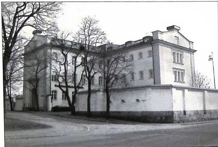
Gamla fängelset

Fängelset upphörde 1968. Sedan slutet av 1980-talet fungerar byggnaden som hotell. Den för den tidens cellfängelser karaktäristiska centrala ljusgården har byggts bort. Dock finns en museal del sparad som visar celler i sitt ursprungliga skick.