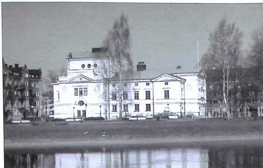
Karlstads teater