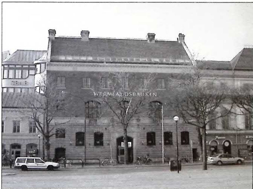
Wermlandsbanken vid Stora Torget, foto Andreas Eliazon

Wermlandsbanken har upphört som självständig provinsbank. Den stora bankhallen disponeras numera av Karlstads Universitet och hallen används som hörsal för offentliga föreläsningar och andra arrangemang samt som publik mötesplats.