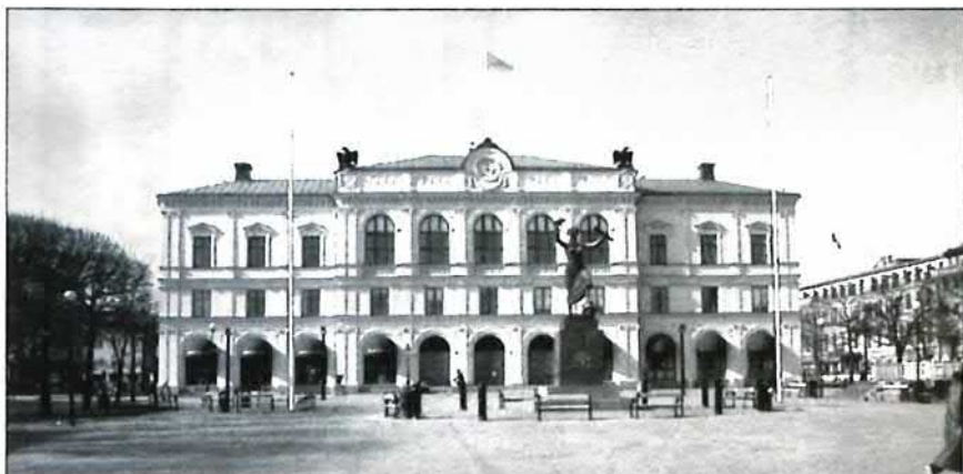
Rådhuset samt Fredsmonumentet vid Stora Torget