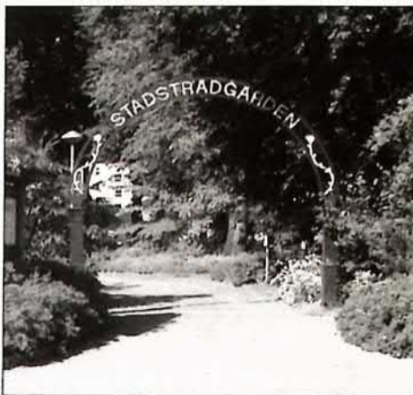
Stadsträdgårdens entré

Stadsträdgården anlades under åren 1863 - 1865. Parken formades efter klassiskt engelskt mönster och tillkom på initiativ av Värmlands Hushållningssällskap. Sällskapet ville att staden här skulle anlägga en promenad- och rekreationspark. Genom att flytta hit den av Hushållningssällskapet år 1854 grundade Värmländska Trädgårdsmästarskolan, vilket skedde år 1864, fick man möjligheter att med hjälp av skolans lärare och elever utforma och plantera parken som också kom att utgöra en skolträdgård.