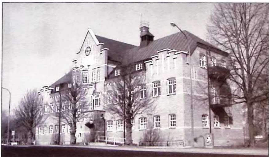
Gamla badhuset

Badhuset byggdes på Häktesberget. Här låg stadens beryktade häkte under större delen av 1800-talet. Bergsknallen mot Pråmkanalen kallas fortfarande för Häktesberget.