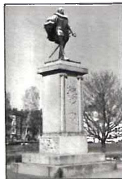
Karl IX

Det rådde emellertid stor tveksamhet om var den skulle placeras. En modell i full storlek av såväl statyn som fundament tillverkades och denna ställdes ut på olika platser i staden för att stadsborna skulle "tycka till". Så småningom enades man om Residenstorget, en öppen plats som härstammar från den tid då det här