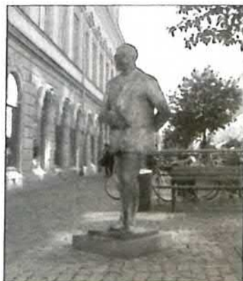
Gustaf Fröding

Gustaf Fröding föddes på Alsters Herrgård, belägen ca 8 km öster om Karlstad. Herrgården är idag en minnesgård över skalden och hans verk. Alsters herrgård är öppen sommartid då verksamheten drivs av Värmlands Museum. På Alster finns även en liten butik främst inriktad på värmlandslitteratur och ett kafé.