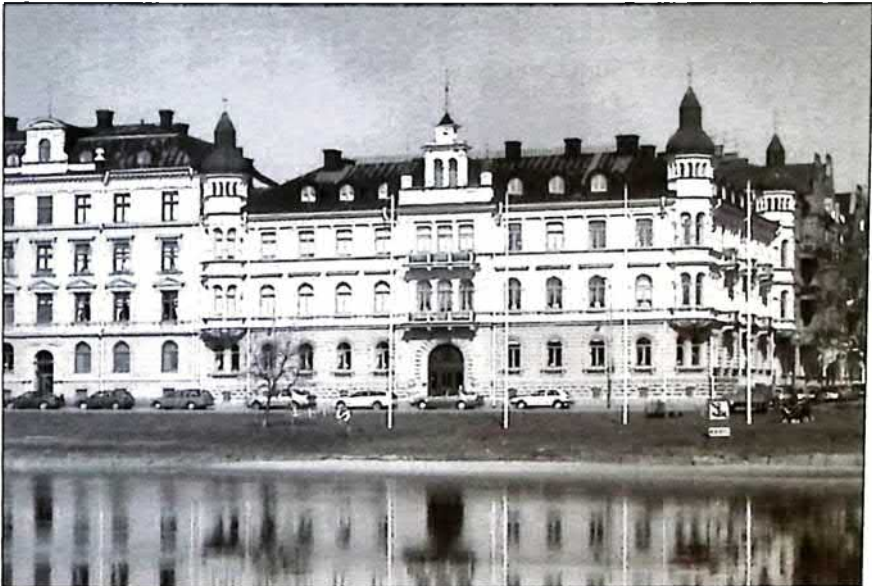
Sockerslottet, foto Anders Eliazon

"Sockerslottet" utsågs nyligen till Karlstads vackraste hus. Det stod färdigt 1899 med en framsida som "lyste som en krokan i solskenet". På sin tid uppmärksammades huset för sina exklusiva badrum. "Sockerslottet" har också fina målningar i trapphuset av Olof W. Nilsson.