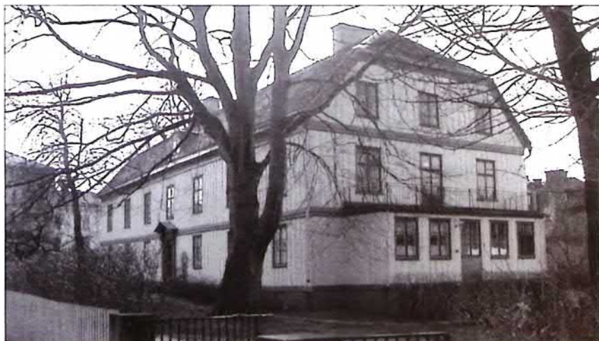
Biskopsgården