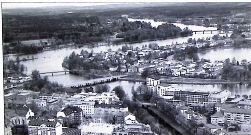
Klarälven norrut

Från Sysslebäck i norra Värmland till mynningen i Vänern är älvfåran bildad i ett lätteroderat sandigt och moigt material. Vid högvatten transporterar därför älven stora materialmängder, som vid mynningen i Vänern bygger upp Sveriges största delta utanför fjällkedjan. Varje vår transporteras så mycket material att det motsvarar en fullastad lastbil var femte minut. Vid extrema högvattentillfällen ökas mängden till en lastbil varje minut. I ett mycket långsiktigt perspektiv kommer hela Hammarösjön söder om Karlstad och som är en del av Vänern att vara utfylld av älvens sandmassor. Det kommer att ta 10.000 år. Men ändå!