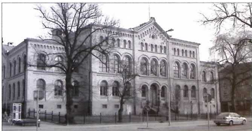
Tingvallagymnasiet