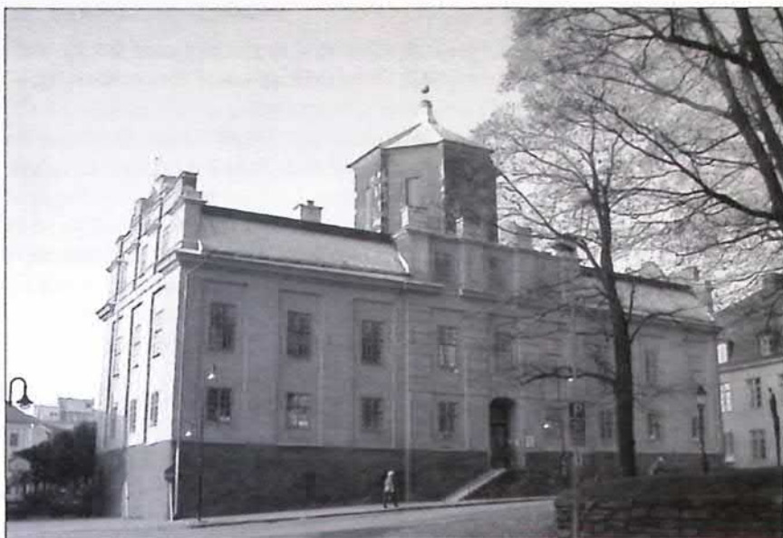
Gamla gymnasiet