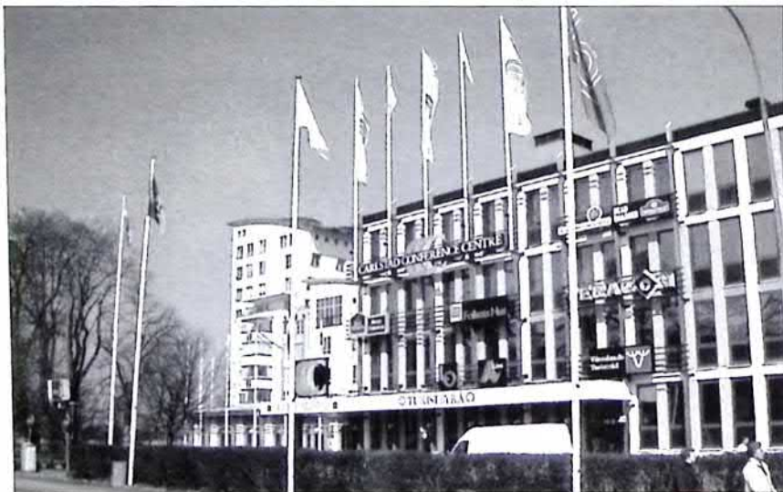
CCC, foto Andreas Eliazon

På platsen låg tidigare Folkets Hus som togs i bruk 1947 och sedan byggdes till i olika etapper. Här fanns stadens största danspalats "Hyttan". Kontorsbyggnaden mot Tage Erlandergatan är den enda kvarvarande byggnadsdelen från Folkets Husepoken. Här finns bland andra Turistbyrån samt Sveriges Radio och Sveriges Television. 1999 tillkom de två tornbyggnaderna. Det lägre rymmer ett hotell medan tiövåningshuset är en bostadsrättsförening med det välvalda namnet "Utsikten".