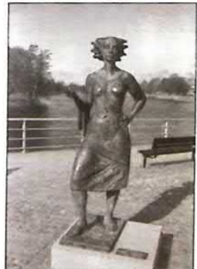
Sola i Karlstad