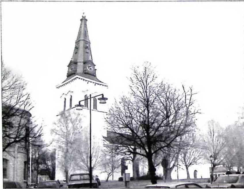
Domkyrkan, foto Andreas Eliazon

1997 - 98 genomfördes den senaste restaureringen.