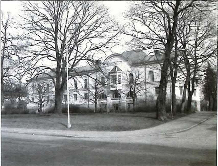
Gamla lasarettet

Lasarettet togs i bruk 1842. Byggnaden uppfördes som en symmetrisk anläggning med den storslagna trappan och entrén som mittpunkt med tre fönsterförsedda salar på var sida om entrén. På var sida om huvudbyggnaden låg två identiska mindre hus av vilka det norra finns kvar med bibehållen exteriör medan det södra byggts ihop med det tidigare lasarettet. Detta skedde när byggnaden övergick från sjukhus till brandstation i början av 1900-talet och brandvagnarna behövde huseras under tak. I dag används byggnaden av Tingvallagymnasiet för både skollokaler och rektorsexpedition.