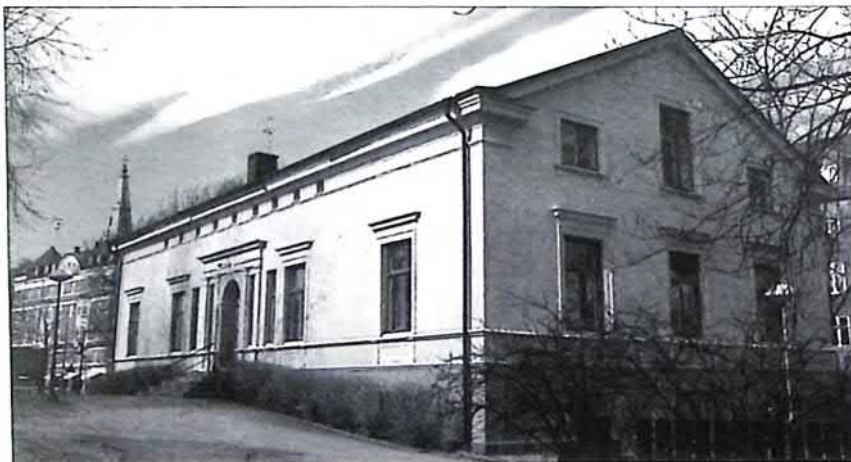
Gamla stadsbiblioteket.

I dag ägs huset av Hyresgästföreningen som har sitt säte där. I markvåningen finns en lokal som tidigare rymt ett konstgalleri men som numera används för föreningsmöten och andra sammankomster. Huset ligger vid Frödingparken. Här hittar vi statyn "Liten dansös" av skulptören Torsten Fridh.