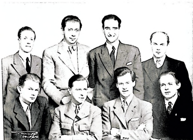
Styrelsen för Karlstads Hantverks-ungdomsgille.