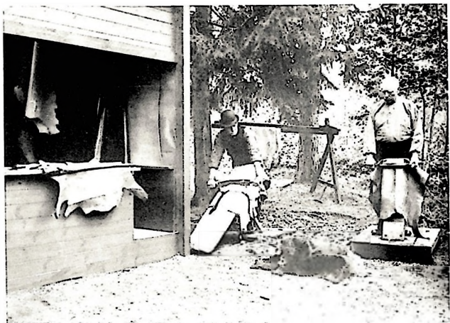
Från Hantverksveckan i Mariebergsskogen 1934. Garvare i arbete.

Vidare bestämes, att medlem av Hantverksföreningen, som uppnått 70 års ålder och tillhört föreningen i 20 år skulle befrias från avgift.