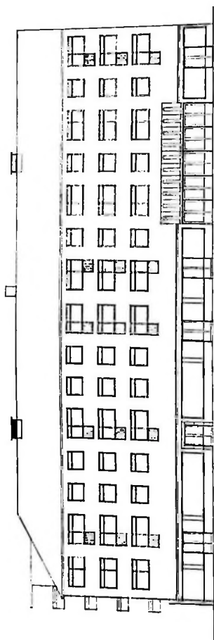
Fasad mot V. Torggatan.