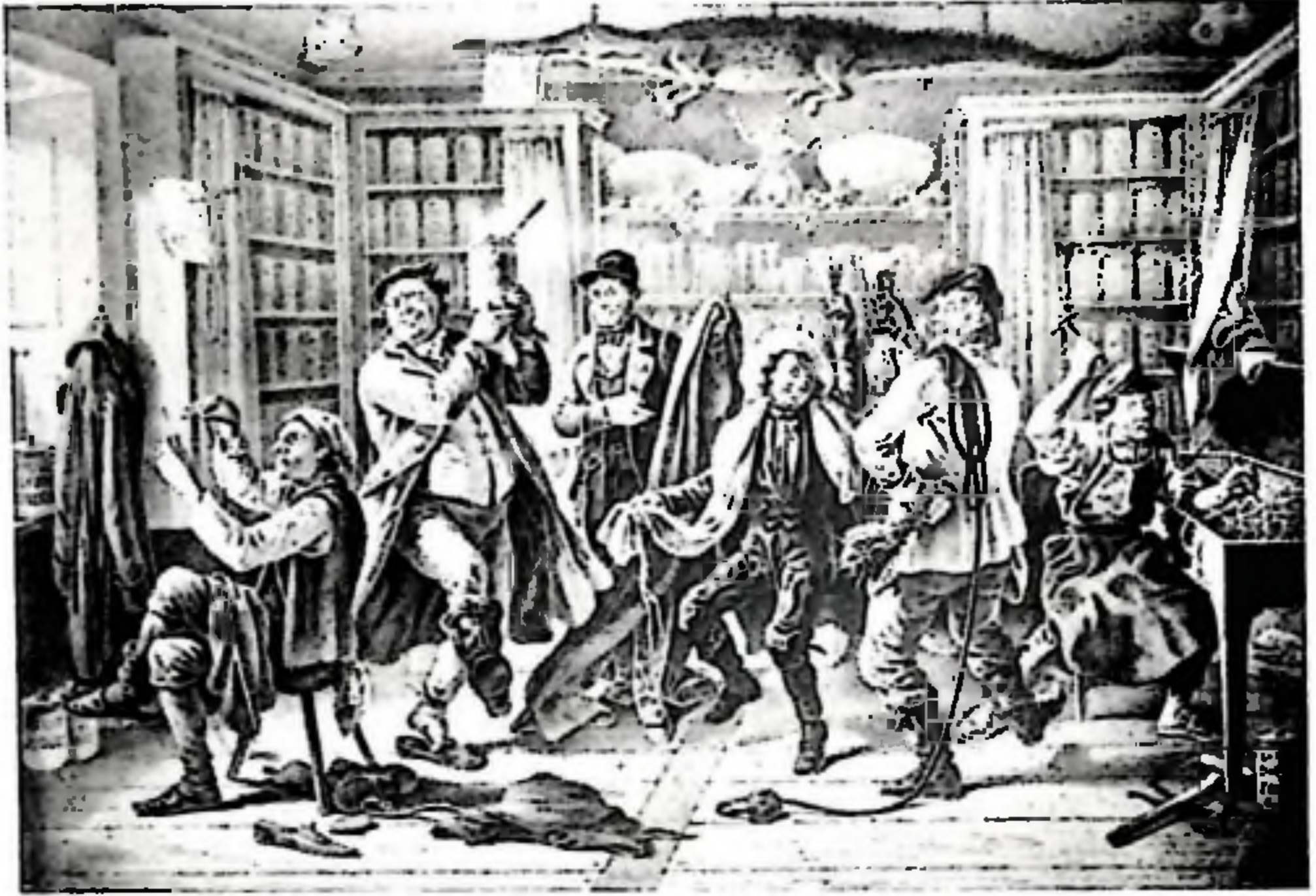
Så här tänkte sig konstnären C. A. Dalström situationen „När alle får göra hvad de vilje“ och en poet skaldade 1846:

Skomakarn vid sin läst Der förr han trüdes allrabäst Han syr nu rock och väst. Och Skräddarn, han blir handelsman, Mjöl'narn, Sotarn byta med varann, Apthekarn håller spisqvarter Och Smeden gör Klavér.