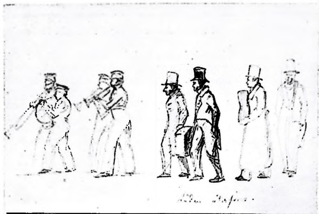
Man höll starkt på traditioner och en mängd ceremonier utvecklade sig vid sammankomsterna. Så här högtidligt gick det till när murarämbetets i Stockholm läda återföres.

seklens mitt. 1809 är det första mer beaktansvärda årtalet i kampen mellan näringsfrihet och skråtvång. I skuggan av de stora händelserna, Gustav IV Adolfs avsättning, förlusten av Finland, tages nu ett första steg mot näringsfrihet. Borgarståndet gör eftergifter vad beträffar rätten att idka borgerlig näring. Denna "koncession" medgav alla medborgarklasser rätt därtill — dock under en förutsättning — nämligen mot utgörande av borgerlig tunga, d. v. s. man måste fullgöra borgerliga skyldigheter. — Några år gå, i Preussen införes under tiden full näringsfrihet, och 1815 är man färdig med att för första gången i vår historia vid riksdagen föreslå allmän näringsfrihet. Det är adeln, som vill krossa borgarståndets urgamla privilegier och som nu föreslår, att stånden gemensamt skall göra en anhållan hos konungen i frågan. Endast bondeståndet instämmer emellertid i förslaget — frågan är för tidigt väckt. Under tiden pågår emellertid en kommittéutredning angående de gällande näringsförfattningarna, det skall emellertid dröja, innan resultatet av denna framlägges, och under tiden hinner smärre beslut komma till stånd. Sålunda förbjödes 1820 den förhatliga bönhaskjakten, om vilken vi tidigare genom citatet ur Cederhielm delgivits folkets uppfattning.