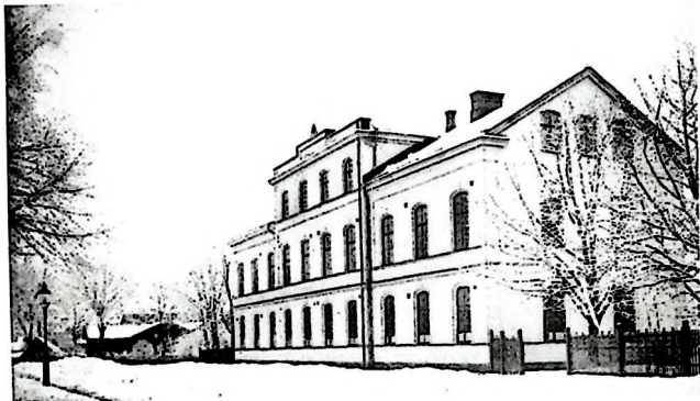
Hantverksskolans lokaler. (Nuvarande Tingvallaskolan vid Drottninggatan.)

till honom en subskriberad fond å 250 kr., som jämte hans eget tillskott blev grundplåten till den ännu existerande Brockmanska fonden.