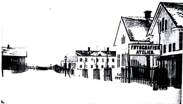
En unik bild från 1866: stadens första gasverk, beläget på föreningens nuvarande tomt.