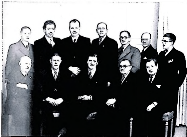
Karlstads Fabriks- och Handverksförenings styrelse 1947.