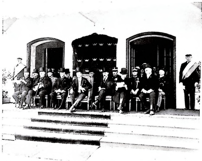
Från den högtidliga invigningen av 1927 års utställning.