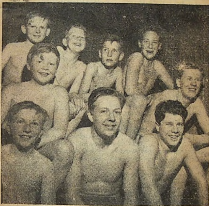
Finnbastun på Skutberget är alla tiders tycker de här pojkarna och många andra karlstadsbor.