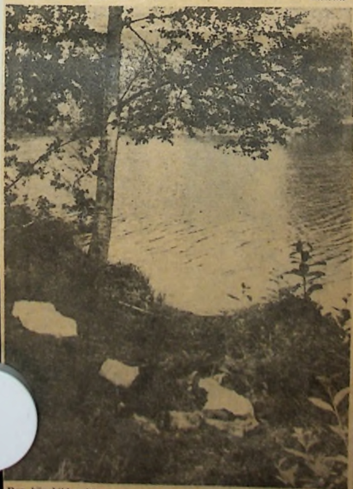
Den här bilden illustrerar mer än vad hur en liten idyll förstörs av några kringlangda papper. Bilden är tagen i Frödingsdungen, där rastande bilturister får lastas för osnyggandet.