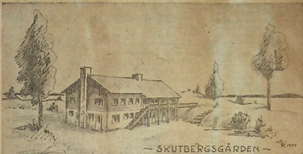
Skutbergsgården byggs i två våningar med altan och direktförbindelse från övervåningen ut på berget.